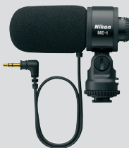
Micro stéréo ME-1